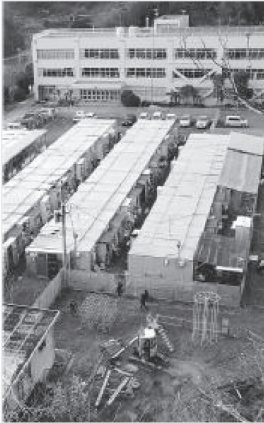
校庭に仮設住宅が建つ被災地の小学校。子どもたちの遊び場は限られ、精神的なストレスや体力低下などが心配される＝東松島市の宮戸小

東日本大震災の被災地で河北新報社が実施した小中学校の校長アンケートは、震災から2年10カ月近くがたった現在も被災児童・生徒が震災の影響とみられるさまざまな問題を抱えている実態を浮き彫りにした。生活基盤の不安定さが子どもに悪影響を及ぼしている現状も浮かび、教育関係者は不安を募らせている。